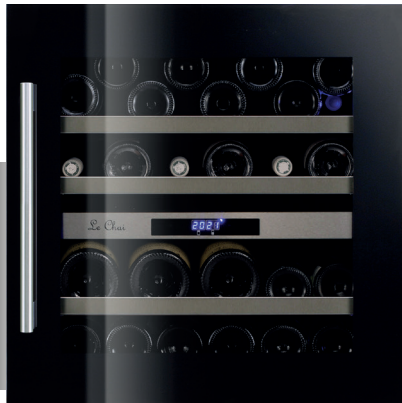
poignées noire et inox incluses