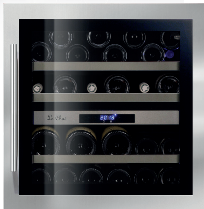
LB 340 INOX