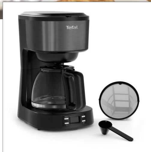
Cafetière filtre Equinox Noire Cafetière filtre Programmable Equinox Noire CM520810