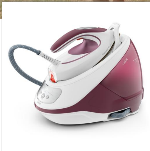
EXPRESS PROTECT SV9201C0 SV9201C0