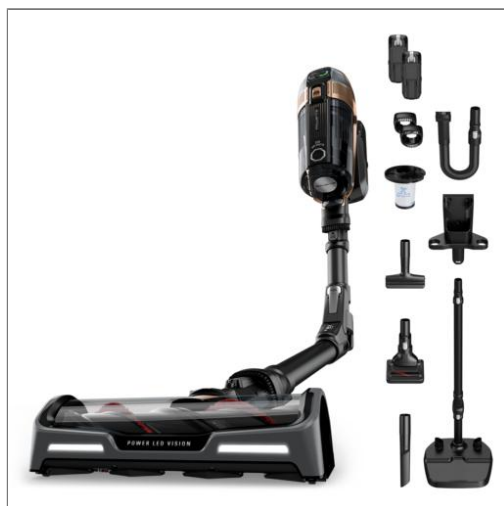
X-Force Flex 15.60, draadloze steelstofzuiger, ultrakrachtige zuigkracht, 245 Airwatt, 2 batterijen RH99F3WO X-Force Flex 15.60, draadloze steelstofzuiger, ultrakrachtige zuigkracht, 245 Airwatt, 2 batterijen RH99F3WO