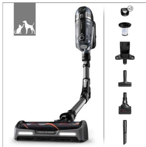
X-Force Flex 14.60 RH99A9 Draadloze Stofzuiger RH99A9WO