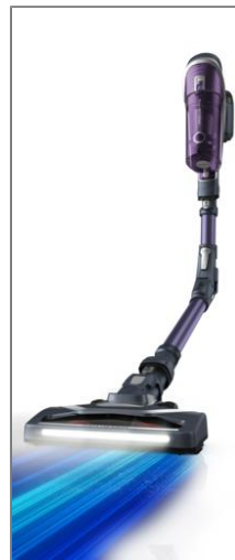
X-FORCE FLEX 8.60 RH9639WO XFORCE FLEX 8.60 RH9639WO