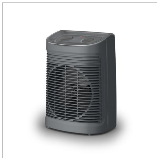
Rowenta Instant Comfort Aqua Chauffage soufflant S06511F2