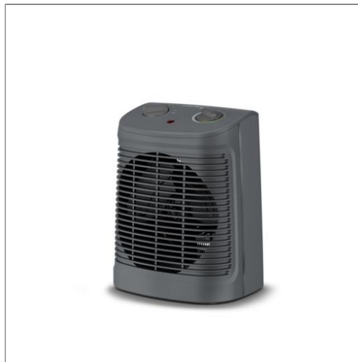
Instant Comfort Compact S02321 Chauffage soufflant S02321F2