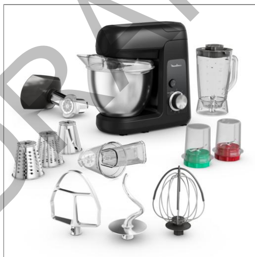
Bake Partner, Robot pâtissier puissant de 1 100 W Moulinex, Robot pâtissier Bake Partner, 1 100 W QA525810