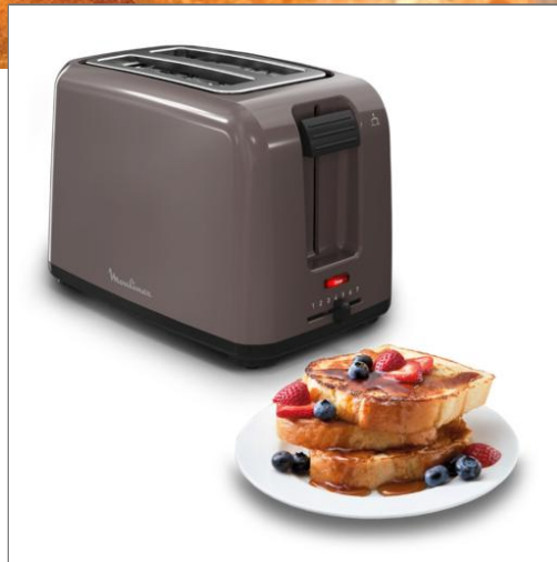
Rio Grille-pain 2 fentes LT1A1910