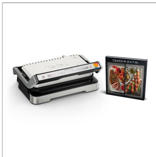
OptiGrill 2-en-1 XL GC782D10 Grill Intelligent - 12 programmes OPTIGRILL 2-EN-1 XL WE GC782D10