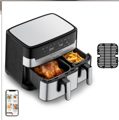
Dual Easy Fry & Grill EZ905D20 Air Fryer - 8 programmes - 5,2L + 3,1L Friteuse à air Dual Easy Fry & Grill 8.3 L en acier inoxydable EZ905D20

5,2L + 3,1L - 6 personnes - 8 programmes - Modèle XXL digital - 2 tiroirs - Inox