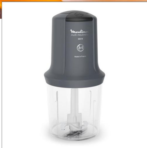
Hachoir électrique 3-en-1 Multi Moulinette de Moulinex AT711B10