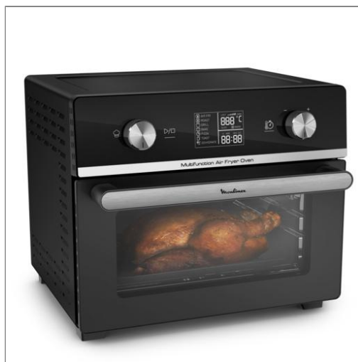
Four friteuse à air Easy Fry multifonction 20 L Four friteuse à air format familial pour des préparations rapides et croustillantes AL606820