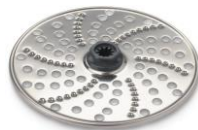
Disque à râper extra-fin