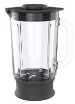
1.5L ThermoResist™ Blender en verre