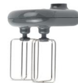
Fouet double en metal