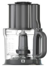
3L Bol (1.5L capacité de travail)