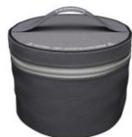
SmartStore™ Sac de rangement