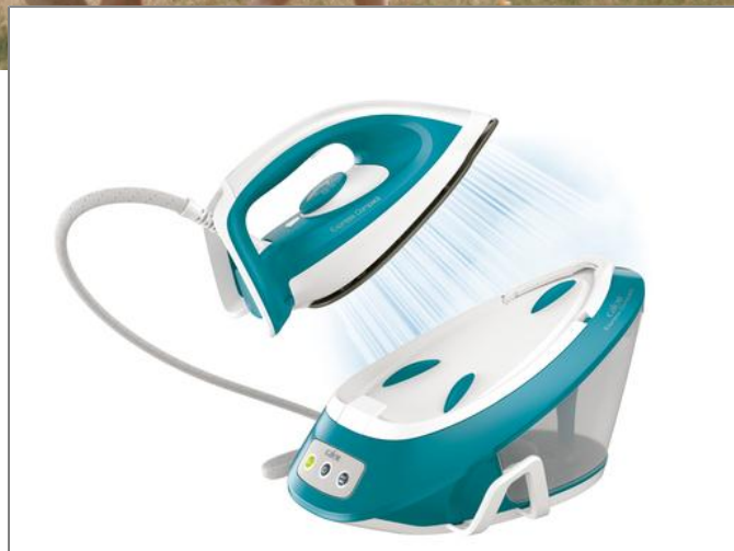
EXPRESS COMPACT SV7111C0 Centrale à vapeur SV7111C0