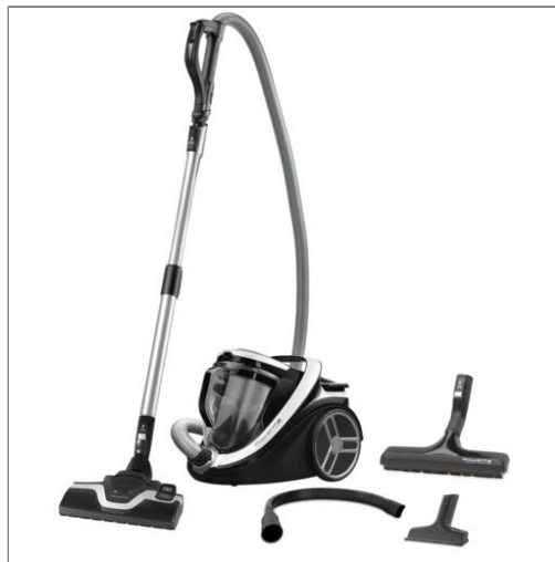
SILENCE FORCE CYCLONIC Aspirateur sans sac R07640EA