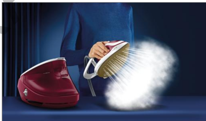
Centrale vapeur Calor Pro Express Ultimate, Pression élevée de 8 bars, Débit de vapeur continu de 170 g/min CENTRALE VAPEUR CHAUFFE RAPIDE PRO EXPRESS GV9723C0