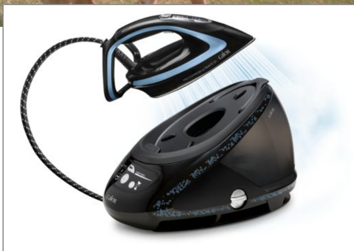
PRO EXPRESS ULTIMATE [+] GV9611C0 Centrale à vapeur haute pression GV9611C0