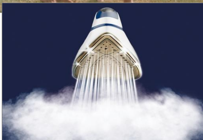
PRO EXPRESS PROTECT GV9221C0 GV9221C0