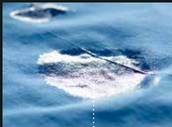
Aan de lucht gedroogd

Ons nieuwe outdoor droogprogramma droogt uw waterproof, ademende stoffen zelfs beter dan wanneer u ze aan de lucht zou laten drogen. Het gebruikt precies de juiste hoeveelheid warmte om de volledige functionaliteit van het waterdichte membraan in waterproof kleding te bewaren. Zo zullen uw prestatiegerichte kledingstukken blijven presteren.