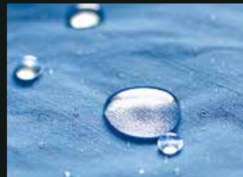
AEG AbsoluteCare® Outdoorprogramma