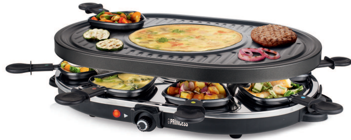
Raclette 8 Oval Grill Party 01.162700.01.001

PARTS DESCRIPTION / ONDERDELENBESCHRIJVING / DESCRIPTION DES PIÈCES / TEILEBESCHREIBUNG / DESCRIPCIÓN DE LAS PIEZAS / DESCRIÇÃO DOS COMPONENTES / DESCRIZIONE DELLE PARTI / BESKRIVNING AV DELAR / OPIS CZĘŚCI / POPIS SOUČÁSTÍ / POPIS SUČASTÍ / OSIEN KUVAVKSET / BESKRIVELSE AF BESTANDDELE / BESKRIVELSE AV DELER