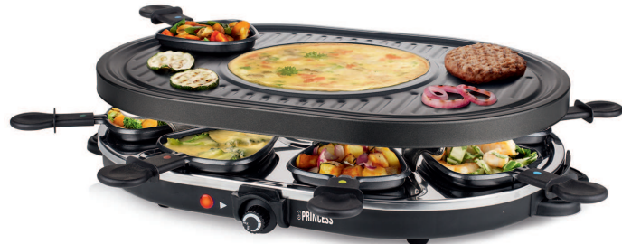
Raclette 8 Oval Grill Party 01.162700.01.001

PARTS DESCRIPTION / ONDERDELENBESCHRIJVING / DESCRIPTION DES PIÈCES / TEILEBESCHREIBUNG / DESCRIPCIÓN DE LAS PIEZAS / DESCRIÇÃO DOS COMPONENTES / DESCRIZIONE DELLE PARTI / BESKRIVNING AV DELAR / OPIS CZĘŚCI / POPIS SOUČÁSTÍ / POPIS SOUČASTÍ / OSÍEN KUVAKUŠET / BESKRIVELSE AF BESTANDDELE / BESKRIVELSE AV DELER