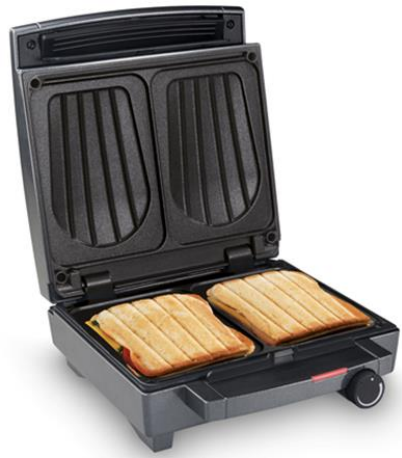
Sandwich Maker SW 1451