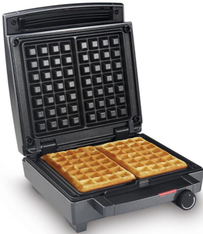
Waffle Maker WA 1451