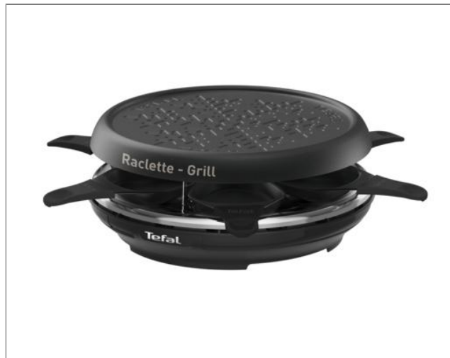
RACLETTE 6 personnes Tefal Neo deco RE12A810