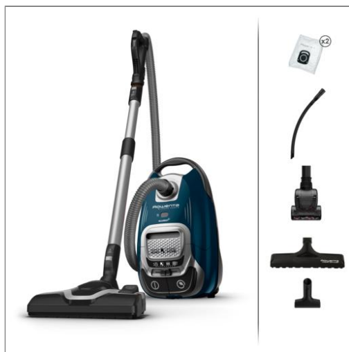
Silence Force Effitech® Car Care stofzuiger met zak R07451EA Rowenta SILENCE FORCE EFFITECH® TOTAL CLEAN R07471EA