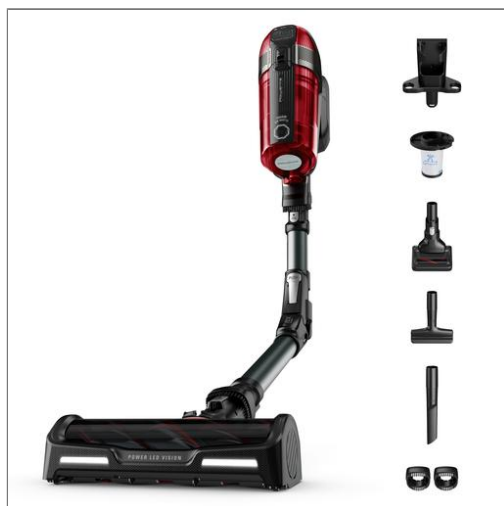
X-Force Flex 12.60 RH98A8 Steelstofzuiger - 150 AirWatt - 45 min autonomie - 0,9L Steelstofzuiger RH98A8WO

150 AirWatt - 45 min autonomie - 25,2V - 0,9L - 7 accessoires - 4 snelheden + Boost - Detectie van vloertype