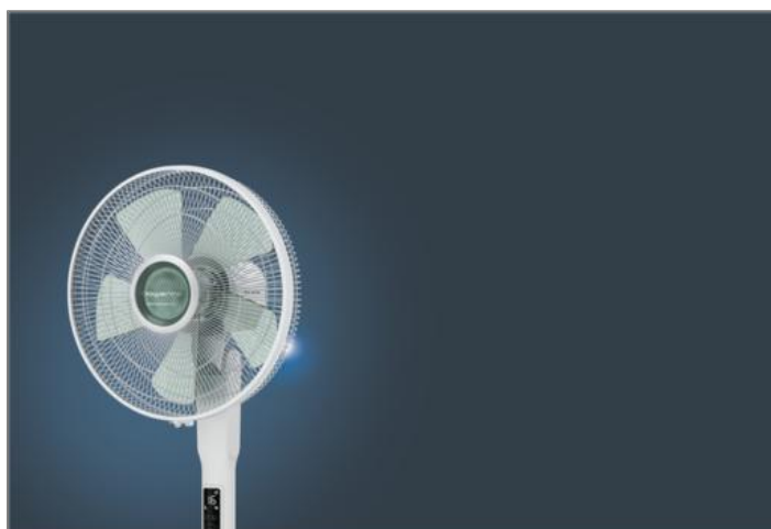
Ventilateur sur pied Turbo Silence Extreme +, Puissant, silencieux et écoénergétique

Ventilateur sur pied Turbo Silence Extreme +, Puissant, silencieux et écoénergétique VU5890F0