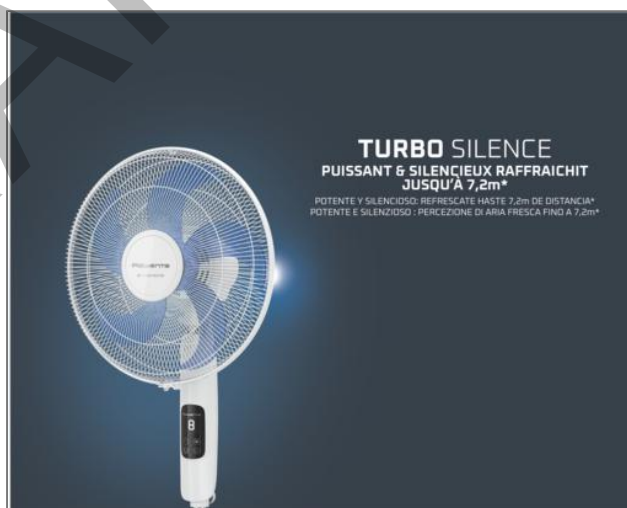
Turbo Silence, Ventilateur sur pied, Puissant, Silencieux, Ecoénergétique Ventilateur sur pied VU5450F0