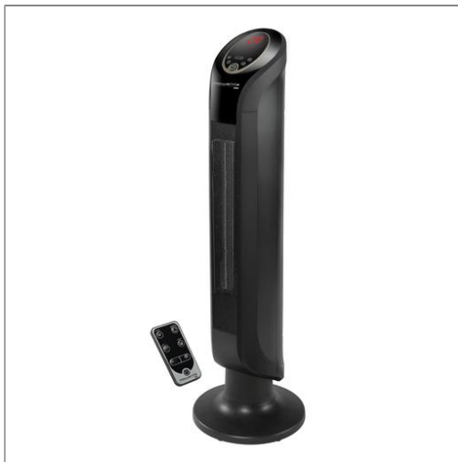
INTENSE COMFORT S09420