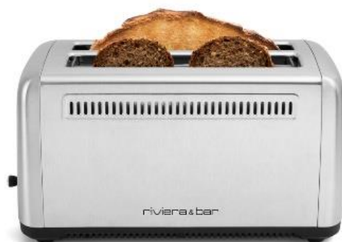
2 fentes extra-larges avec système d'auto-centrage

Sélecteur de Dorage : Choisissez parmi les 6 niveaux de dorage pour obtenir la texture parfaite, que vous préférerez des pains fins et délicats ou des pains plus épais et rustiques. Le processus s'arrête automatiquement, et le chariot remonte dès que le dorage est terminé.