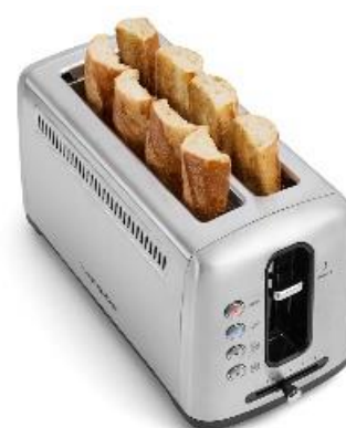
Position « High Lift » pour récupérer facilement les petites tranches