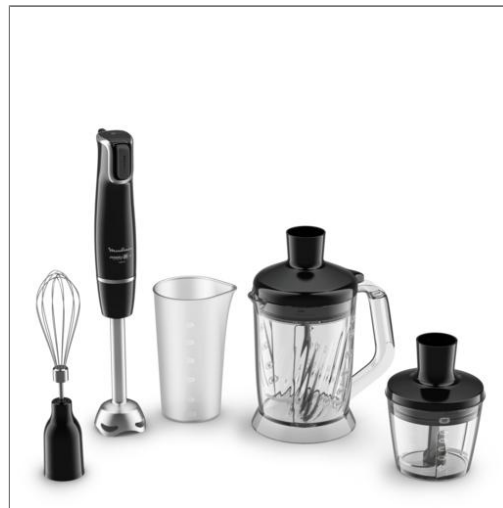
Mixeur plongeant Infinyforce avec hachoir mixeur XL DD94L810