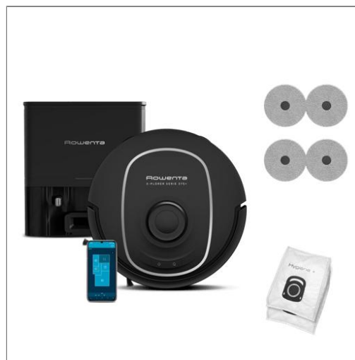
XPlorer Série 375+ RR8985E0 Robotstofzuiger met automatisch leegstatio - 8.000Pa - 360° lasertechnologie X-PLOERER SERIE 375+ STANDAARD RR8985E0